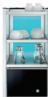
LODÓWKA NA MLEKO Z PODGRZEWACZEM FILIŻANEK

LODÓWKA Z WYJMOWANYM ZBIORNIKIEM NA MLEKO O POJEMNOŚCI 9,5 L, PODŚWIETLENIE, ZAMEK, WYMIENNA USZCZELKA DRZWI, 230 V, 2 WERSJE: - WĄSKA, 3 PODGRZEWANE PÓLKI, 286X566X530 MM (S,G,W) - SZEROKA, 2 PODGRZEWANE PÓLKI, 368X567X530 MM (S,G,W)