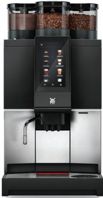
WMF 1300 S