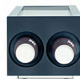
PODAJNIK NA KUBKI PAPIEROWE

POJEMNOŚĆ 6,5 L, WYJMOWANY ZBIORNIK, ZAMYKANA, WYMIENNA USZCZELKA DRZWI 228X463X392 MM (S,G,W) 230 V