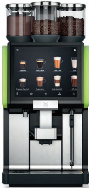
WMF 5000 S+