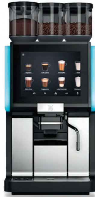
WMF 1500 S+