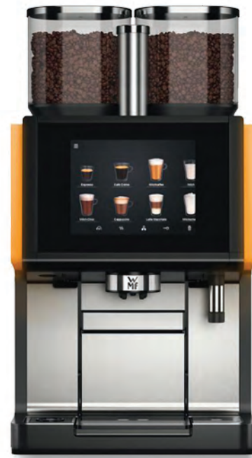
WMF 9000 S+