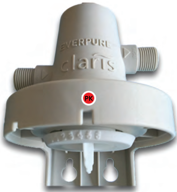
GŁOWICA TYP 1 RYS. A1